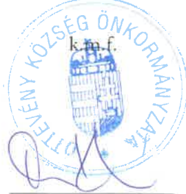
Tuba Kálmán jegyzőkönyv hitelesítő