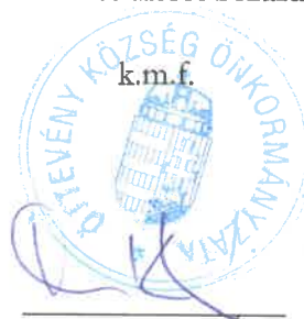
Tuba Kálmán jegyzőkönyv hitelesítő