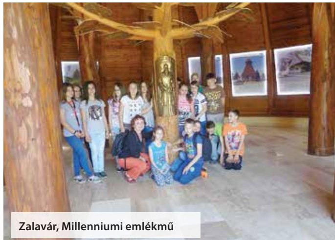
Zalavár, Millenniumi emlékmű