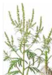
Ambrosia artemisiifolia (Parlagfű)

Áprilisban jelenik meg, de a legintenzívebb növekedési időszaka júliusban van. Ezután természetessé válása lelassul, és virágozni kezd. Porzós virágai már július elején, illetve közepén megjelennek, a termős virágok egy-másfél héttel később. A virágpor szél útján akár 100 kilométeres távolságokra is képes tömegesen eljutni.