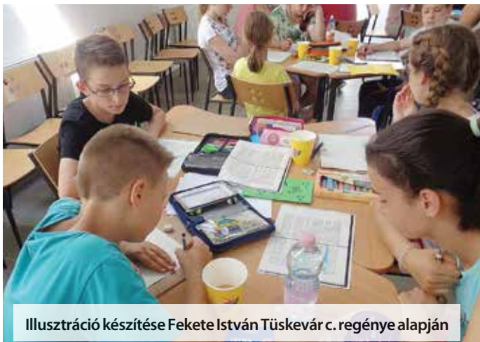
Illusztráció készítése Fekete István Tüskevár c. regénye alapján

A projekttel iskolánk tehetségfejlesztő hagyományát folytattuk. Témája „A csodálatos víz”, mely szorosan kapcsolódik iskolánk Ökoiskolai programjához. A tehetségműhely foglalkozásain, a szaktáborban, a kiállításokon változatos