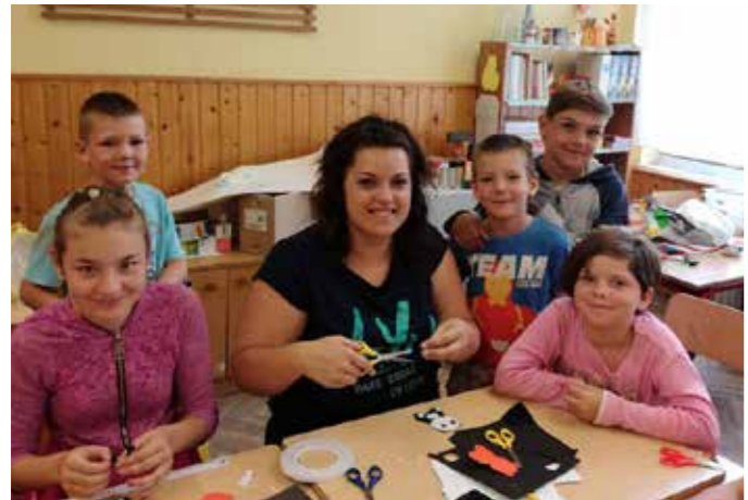
Néhány kép a táborból:

közis táborát, az Ötvenyi Általános Iskola 1-5. osztályának, mely egyaránt célozta a dolgozó szülők számára a szünidei gyermekfelügyelet megoldásának segítségét, másrészt a gyermekek sokrétű, vidám szabadidő-eltöltését. A táborozók felügyeletét és foglalkoztatását Szolgálatunk és az önkéntes munkatársak biztosították. Az öt napos tábor minden perce vidámsággal telt; néhány a megvalósult programokból: Az első nap játékos feladatokon keresztül kövacsolódtak a gyermekek egy csapattá. Kedden a szili táborhoz csatlakoztunk, ahol a Marcus Security és a Győr- Moson- Megyei Rendőrkapitányság Forgalom Ellenőrző Alosztály munkatársai biztosították a gyermekeknek izgalmas programot. A szerdai napon az Őszidők Nyugdíjas Egyesület készült egy zenés, szórakoztató interaktív műsorról, melyet mind a gyermekek, mind a felnőtt kísérők nagyon élveztek. Délután az Ötvenyi Önkéntes Tűzoltók tevékenységéről tudhattak meg többet a gyermekek. Csütörtökön Tatára vonatoztunk. A tatai vár látogatása után sétára indultunk a tatai tó partján egészen az Építők parkja játszótérig. A lángosozás és a fagyizás után, a beígért szabad strandi „csobbanás” sem maradt el. Pénteken a gyermekek kreatív foglalkozás keretében különböző mintájú hűtőmágnest készíthettek, gipszformákat festhettek. Reméljük, hogy az együtt töltött hét valamennyi táborozó gyermeknek sok örömet, maradandó élményeket jelentett, jövőre is szeretettel várjuk a résztvevőket!